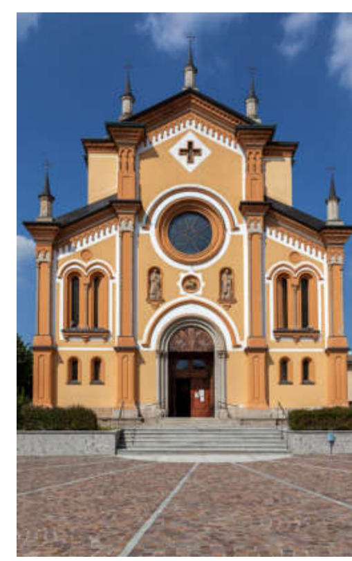
Chiesa di San Gregorio Magno

PGT adeguato alla L.r. n.31/2014 e s.m.i.